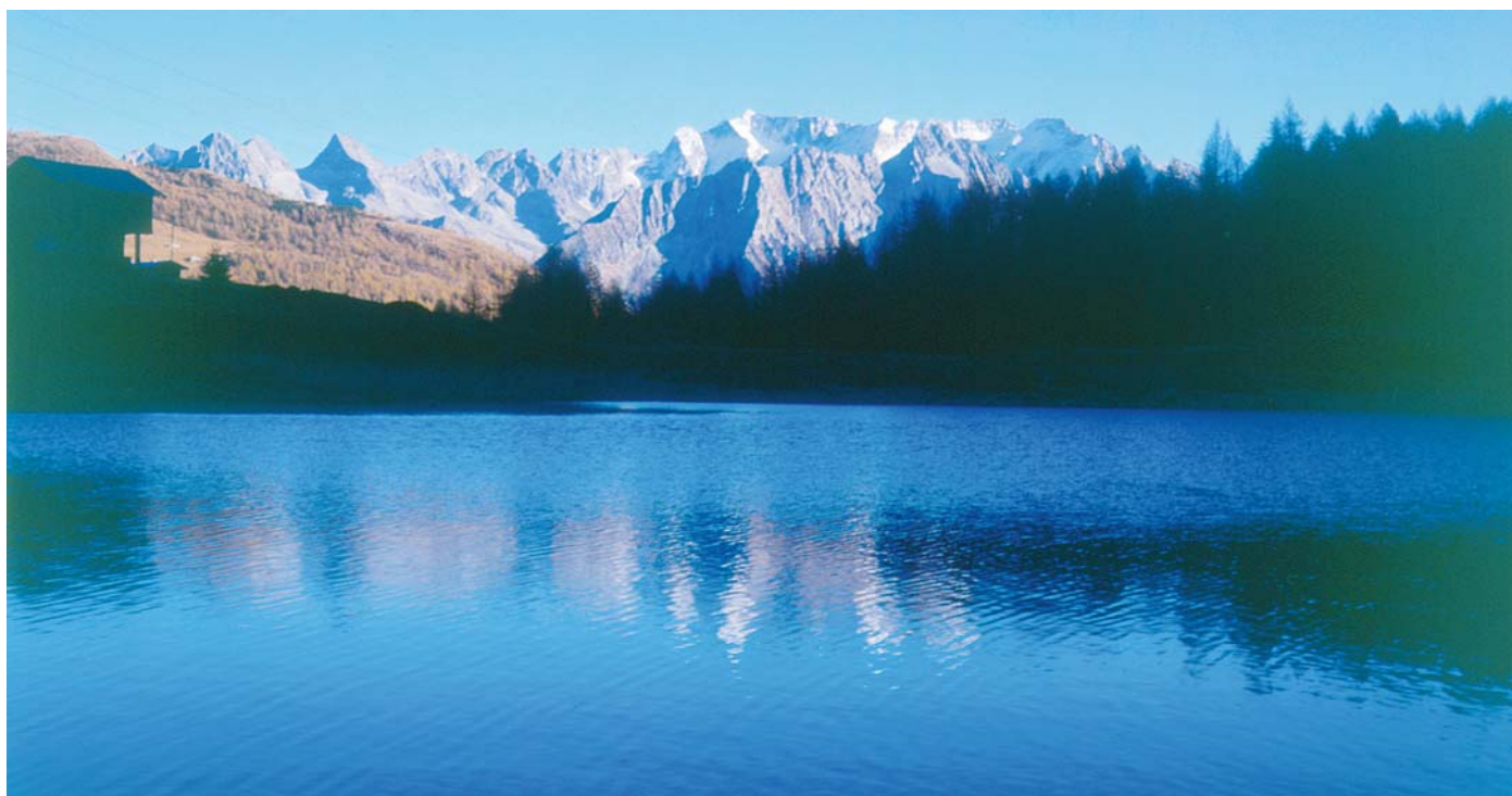
Il laghetto del Mortirolo con il Corno Baitone

Dal novembre del 1944 all'aprile del 1945, il Mortirolo fu importante caposaldo dell'attività partigiana nell'alta valle Camonica. Ma è agli inizi degli anni Novanta che il Mortirolo assurge a fama di grande popolarità sportiva, con il passaggio del Giro ciclistico d'Italia. Ad alimentare la leggenda hanno contribuito, tra gli altri, inesausti campioni del pedale come Ivan Gotti, Paolo Savoldelli e Marco Pantani, soprannominato il "pirata", che proprio su quelle durissime erte intrise di sudore e fatica, si rivelò al mondo sportivo nel 1994, costruendo il suo mito con un'impresa eccezionale. Ma la storia recente e passata del Mortirolo, si fonde magnificamente con le sue peculiarità turistiche ed escursionistiche, che quello