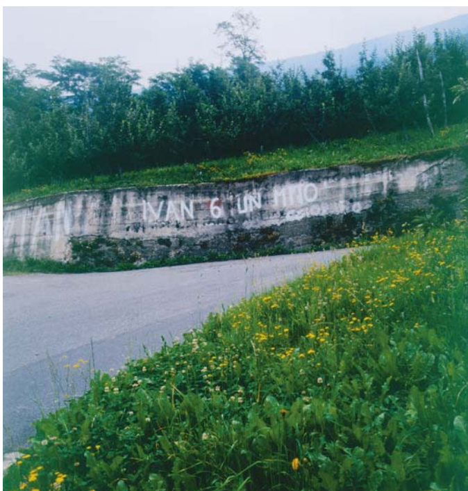
Sulla strada del Mortirolo; mitico banco di prova di indimenticate edizioni del Giro d'Italia

Al Mortirolo si può accedere da Monno, dal Passo dell'Aprica per la panoramica strada della Guspessa e da Mazzo in Valtellina attraverso l'omonimo passo.